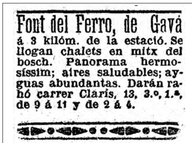
Figura 3. Text aparegut a La Vanguardia l'any 1911 per anunciar el lloguer d'habitatges a la Colònia Amat.

nades d'estiu s'hi congregaven fins a un centenar de persones. Una ressenya de l'any 1896 fa referència a aquesta colònia d'estiuejants: «Si bién ha refrescado notablemente el tiempo, continúan todavía entre nosotros algunas de las familias de la capital que vinieron aquí a pasar el verano; demora que sin duda sabrán aprovechar en recorrer los bosques inmediatos en busca de los sabrosos "rovellons" que pronto saldrán en abundancia, ya que llegó su temporada y el terreno se halla con la humedad y frescura que su aparición necesita. Y al mismo tiempo que practicando el ejercicio antes dicho podrán admirar las bellezas y tesoros naturales que contienen las montañas vecinas, desde algunos de sus elevados picos, como el Pla de las Bassas, Sant Miquel, Bruguers y algún otro [desde los que] se descubren deliciosos panoramas, y entre cuyos riscos y sinuosidades hay fuentes tan ricas como las del Mas Vilar, d'en Bru, y sobre todo la de hierro de casa Amat, cuyas aguas, según competente dictamen facultativo, contienen carbonato férrico y cloruro cálcico, gas, ácido carbónico y sales de magnesia y sosa, teniendo sobre las demás aguas ferruginosas la ventaja de que lejos de ocasionar restricción