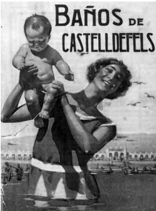
Figura 10. Portada del fulletó promocional dels Baños de Castelldefels, de 1930.

1936, indica fins a quin punt la platja de Castelldefels era, a cavall dels anys vint i trenta, un lloc d'estiueig privilegiat, tot i que de caire molt més popular que les colònies d'estiuejants de Begues i Gavà acabades d'esmentar. 21