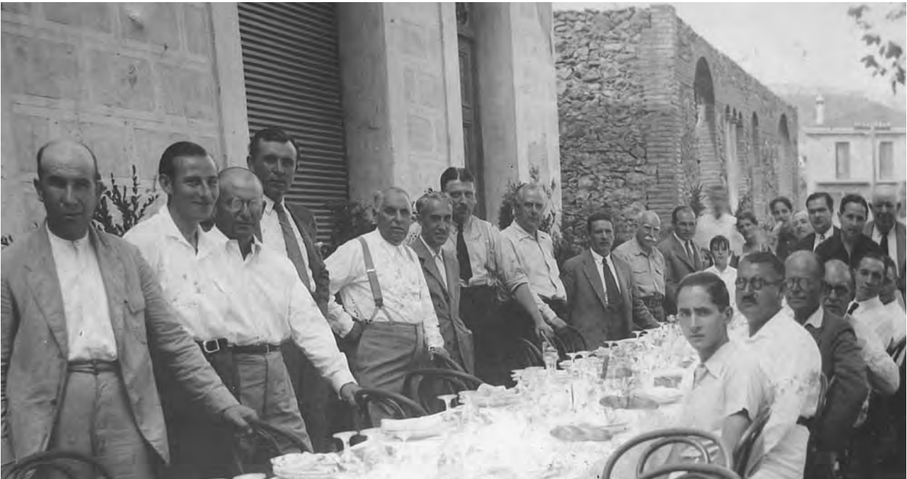
Figura 9. La colla de l'arròs, grup d'estiuejants d'on va sorgir la idea de construir la Cuca-fera, una de les primeres mostres de bestiar popular i tradicional de la comarca.