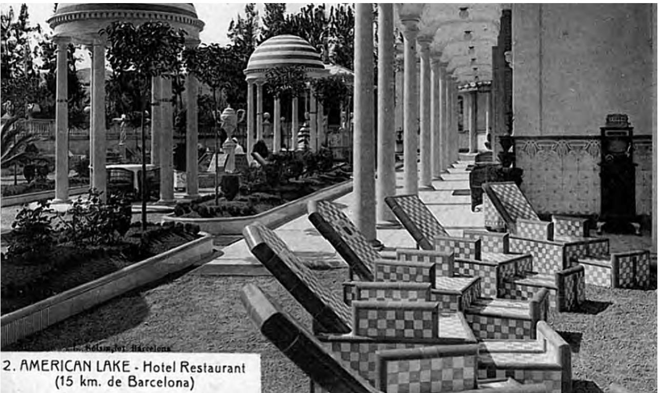
Figura 14. Imatge d'un dels pavellons del parc de l'American Lake de Gavà.