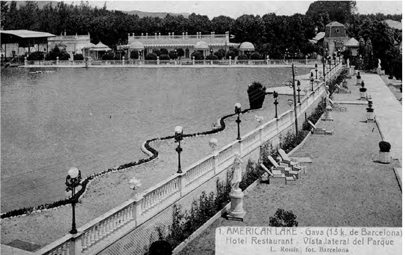
Figura 13. Imatge del llac de l'American Lake de Gavà.