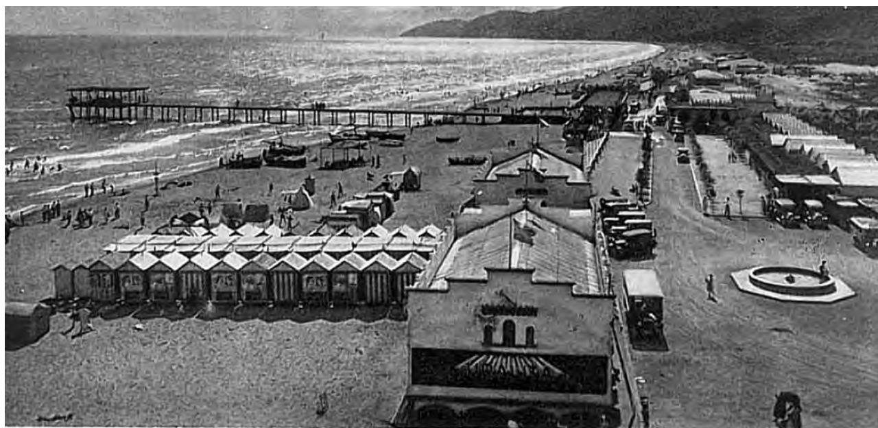
- BAÑOS DE CASTELLDEFELS L'AYA GIGANTE - PLATJA GEGANT