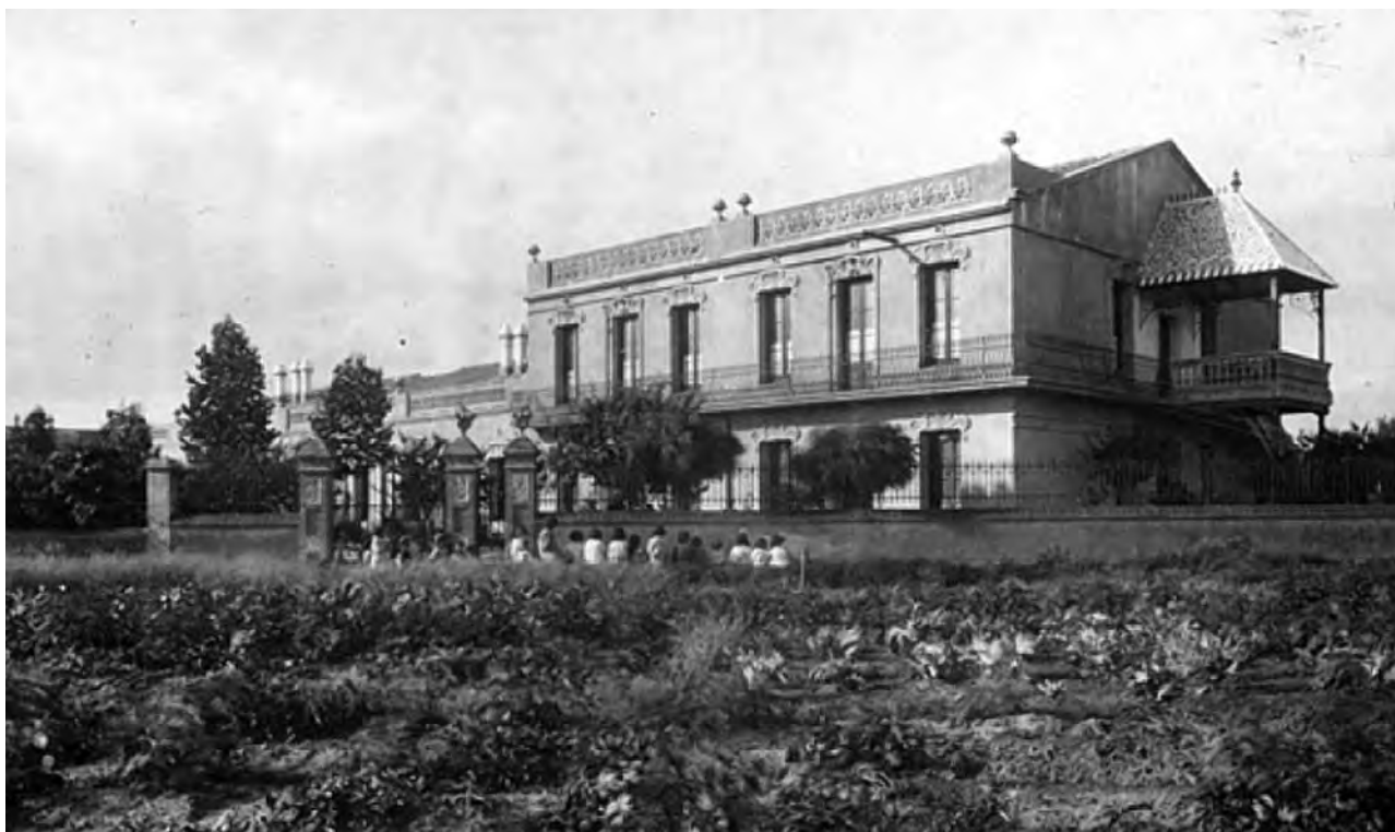
Figura 7. Hotel Petit Canigó, a Begues, l'any 1915.